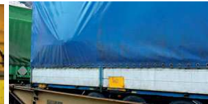
náklad opřený o plachtu