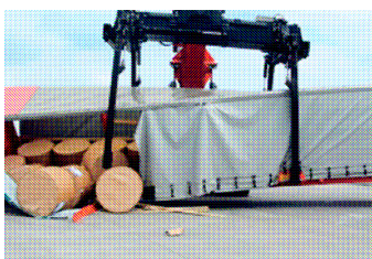
špatně zajištěné zboží