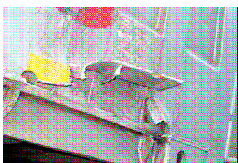
poškozené uchopovací prvky