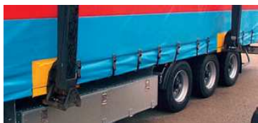
označené uchopovací prvky