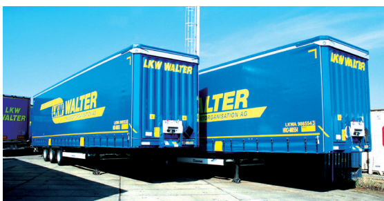
Intermodální návěsy na terminálu ČD DUSS