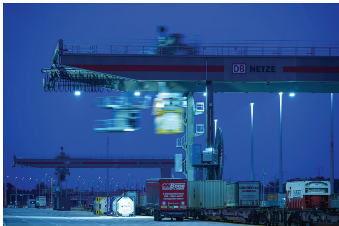
Překládka proběhne během 3-4 hodin.