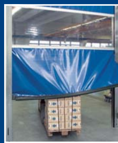
Flexibilní rychloběžná vrata s ochranou proti najetí SoftEdge

Tam, kde záleží na plynulém pracovním procesu, jsou žádána inteligentní řešení. Taková získáte u firmy Hörmann, a to kompletně od jednoho výrobce: nakládací můstky, těsnicí límce vrat, předsazené komory a průmyslová vrata, vše dokonale vzájemně sladěno a vhodný systém pro každou situaci.