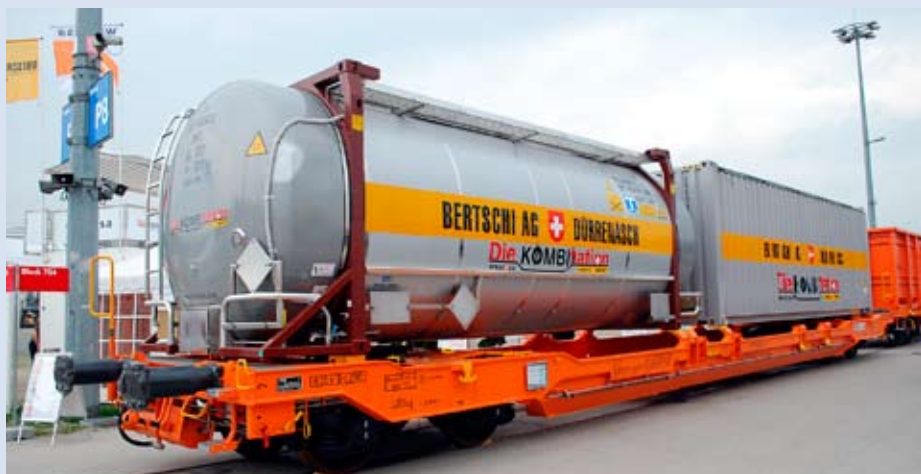
Přepravní jednotky kombinované přepravy

nici do již jmenovaných českých a slovenských terminálů, případně také až na železniční vlečky konečných příjemců. I v těchto speciálních případech ale zůstává obchodním partnerem vůči konečnému příjemci silniční dopravce, který je držitelem přepravní jednotky.